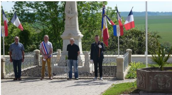
14 juillet 2020