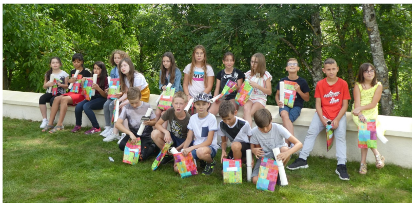
Promotion CM2 2020