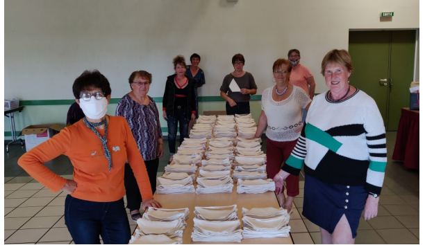
Confection des masques - salle polyvalente - juin 2020

L'ensemble des membre du CCAS vous souhaite une bonne année 2021. Prenez soin de vous et de vos proches.