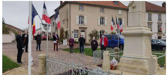
11 novembre 2020